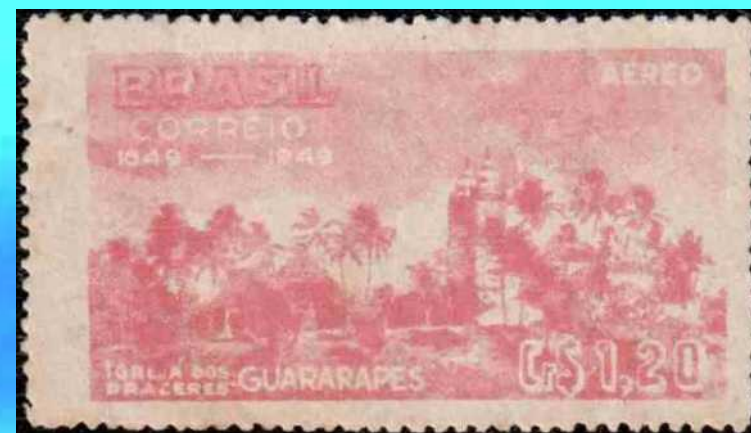
RHM A-71 Tricentenário da Segunda Batalha de Guararapes