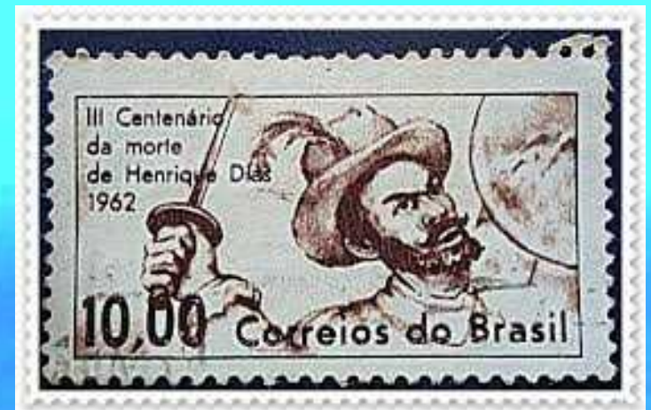
RHM C-472 1962 - Tricentenário da morte de Henrique Dias

Com a invasão da Paraíba (1634) e as conquistas do Arraial do Bom Jesus e do cabo de Santo Agostinho (1635) pelos holandeses, as forças comandadas por Matias de Albuquerque entraram em colapso e se viram forçadas a recuar na direção do rio São Francisco.