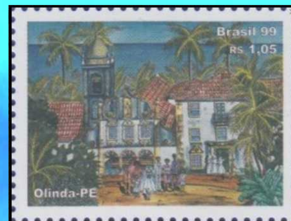
C-2199 - Olinda