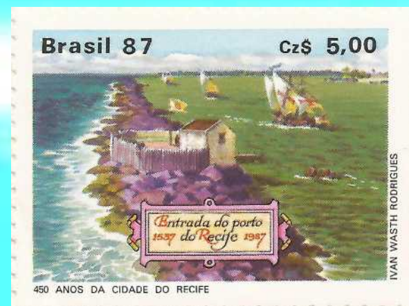
C-1565 - Recife

Por falta de mão de obra a Companhia Holandesa das Índias Ocidentais começou a traficar escravos da África para o Brasil.