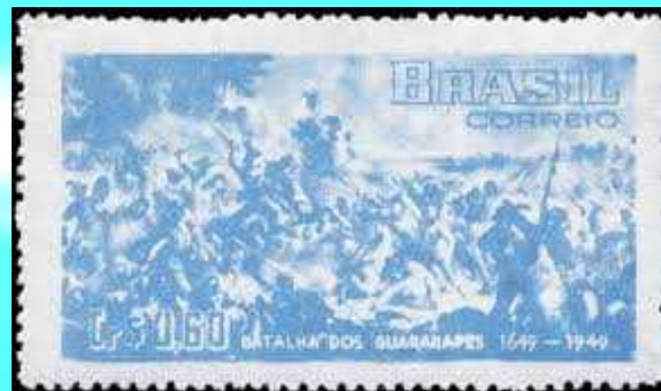
RHM C-243 Tricentenário da Segunda Batalha de Guararapes

Na região Nordeste Maurício de Nassau foi substituído na administração, quando os novos administradores passaram a cobrar as dívidas dos senhores de engenho, política que conduziu à Insurreição Pernambucana de 1645 e que culminou com a extinção do domínio holandês após a segunda Batalha dos Guararapes.