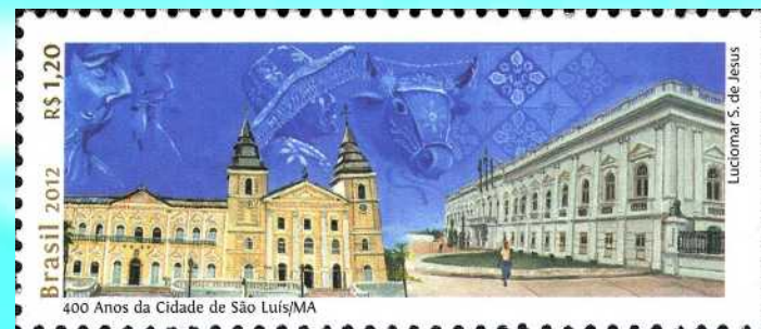
RHM C-3231 400 anos da Fundação de São Luis do Maranhão

As operações militares duraram até 1615, com Jerônimo comandando os soldados pelo sertão. Ao final recebeu do Rei Felipe III o título de Capitão Mor da Conquista do Maranhão.