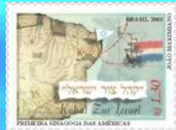
C-2409 – Primeira Sinagoga das Américas