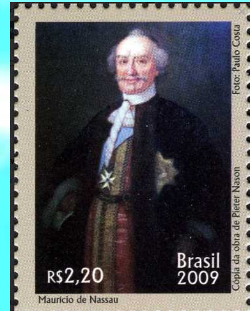
C-2847 Maurício de Nassau

Administrou o abastecimento e mão de obra, além de fazer uma reforma urbanística no Recife, chamada de Cidade Maurícia. Concedeu liberdade religiosa, registrando-se a fundação, no Recife, da primeira sinagoga do continente americano.