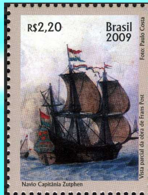
RHM C-2848 – Nau Holandesa

O Governador da Capitania de Pernambuco, Matias de Albuquerque foi nomeado Governador-Geral, administrando a colônia a partir de Olinda, e enviando reforços para a guerrilha.