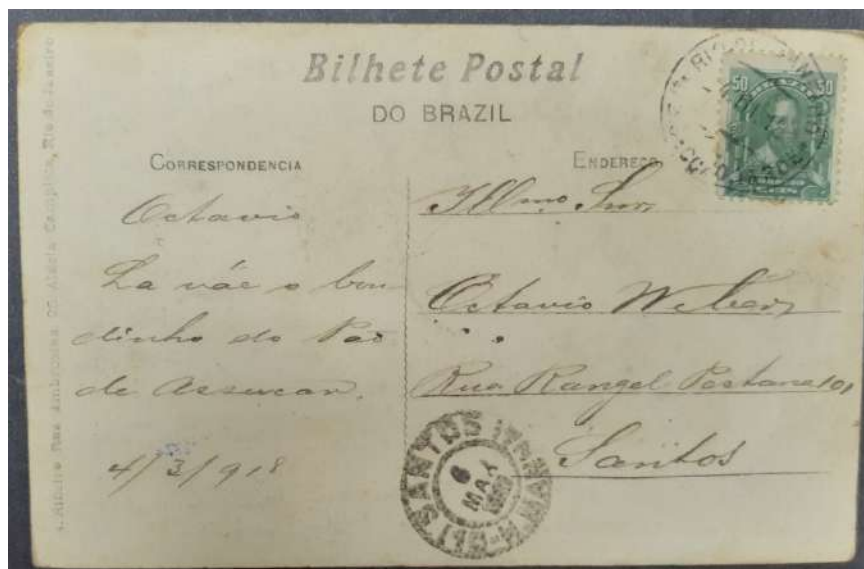
Fig. 4- Cartão postado em 1918. Um dos primeiros elementos filatélicos na coleção do menino Octávio A. Weber.

Sempre metuculoso, Octávio estudava, sob diversos aspectos, os selos recebidos e, para isto, se servia de vários instrumentos para tratamento destes selos. Criou para si um kit filatélico que futuramente iria difundir, principalmente quando o Clube recebia estudantes e principiantes.