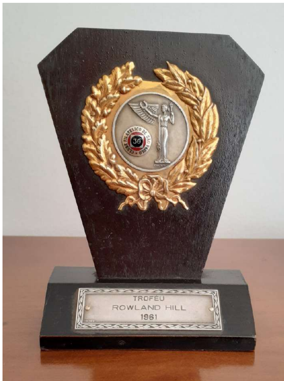
Fig. 7 – Troféu recebido por Octávio Augusto Weber