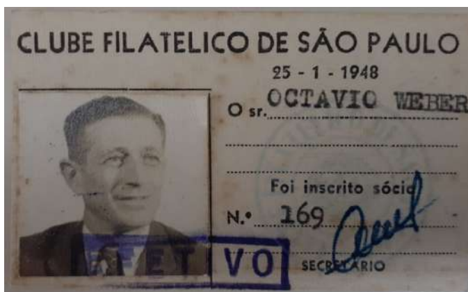
Fig. 6 – Carteira de sócio efetivo em 1949.