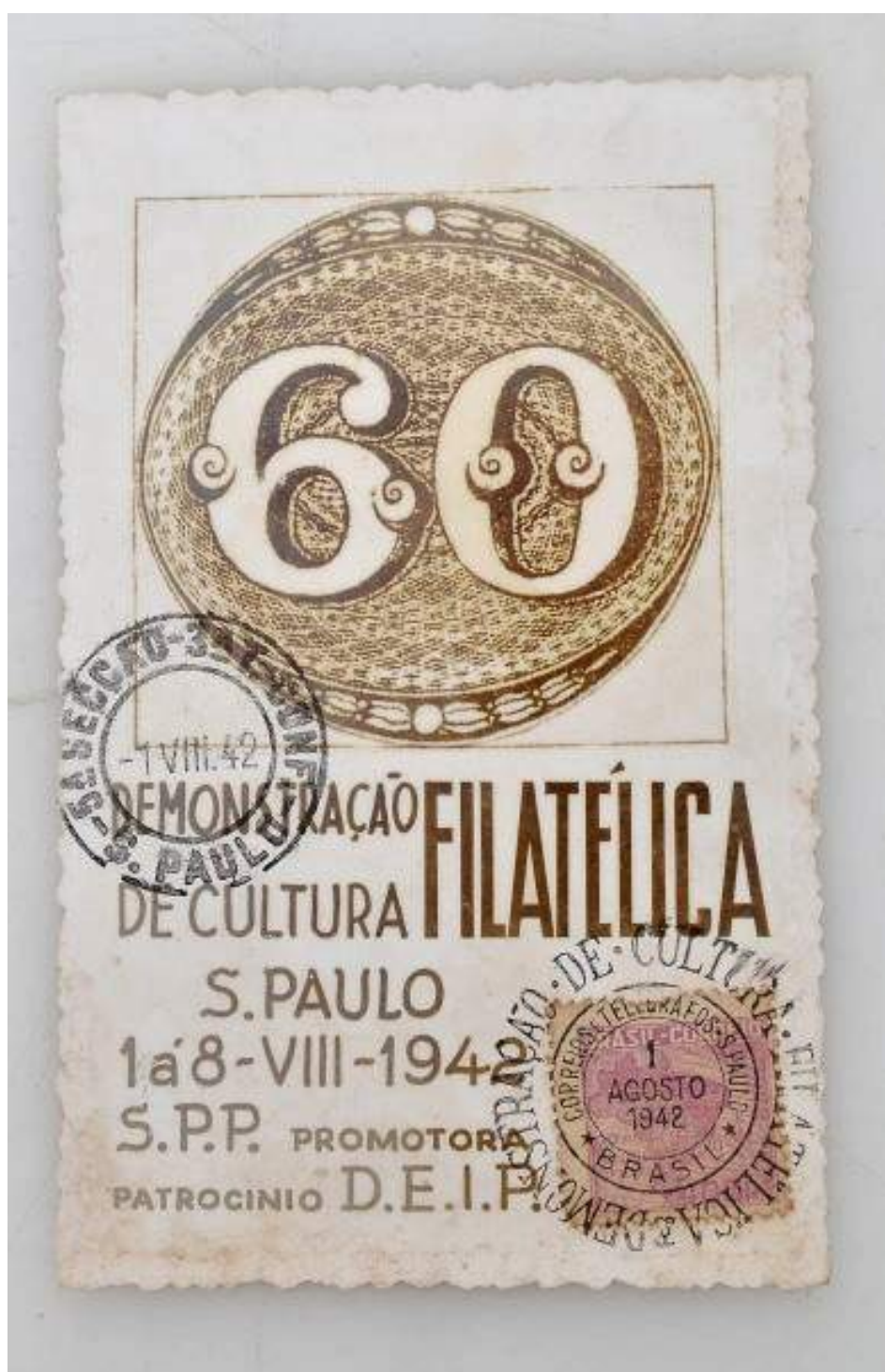
Folhinha Filatélica Demonstração de Cultura Filatélica de São Paulo promovida pela Sociedade Philatélica Paulista 1 a 8 de agosto de 1942