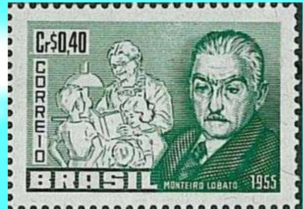
RHM C-370 – Homenagem a Monteiro Lobao