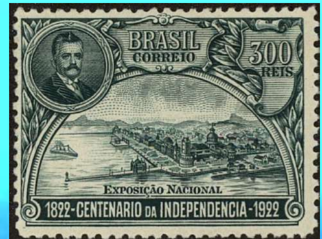
RHM C-16 - Centenário da Independência Exposição Nacional do Brasil

Inaugurou a primeira estação de rádio no Brasil. Cancelou o banimento da Família Real do país.