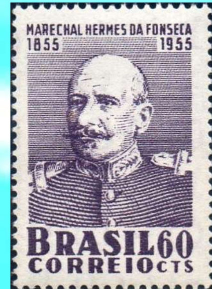
RHM C-364 - Hermes da Fonseca

Enfrentou a Guerra do Contestado, que não chegou ao fim no seu governo. O conflito armado envolveu posseiros e pequenos proprietários de terras, de um lado, e governos estadual e federal de outro, entre outubro de 1912 e agosto de 1916, numa região rica em erva-mate e madeira disputada pelos estados do Paraná e de Santa Catarina, marcada por conflitos ligados a disputas de limites entre os dois estados.