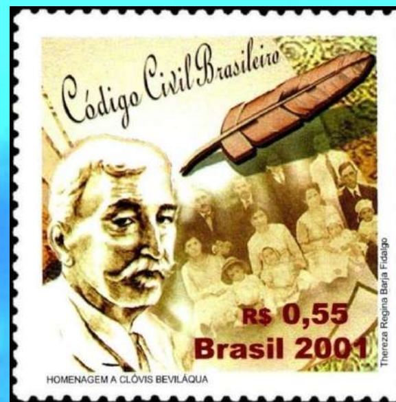
RHM C-2407 - Homenagem a Clóvis Bevilacqua Pai do Código Civil Brasileiro