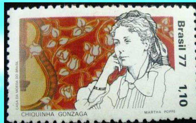
Chiquinha Gonzaga

Aquela noite ficou conhecida como A NOITE DO CORTA-JACA.