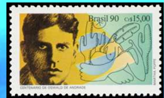
RHM C-1709 – Centenário de Oswald de Andrade