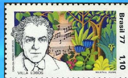
RHM C-979 - Heitor Villa-Lobos