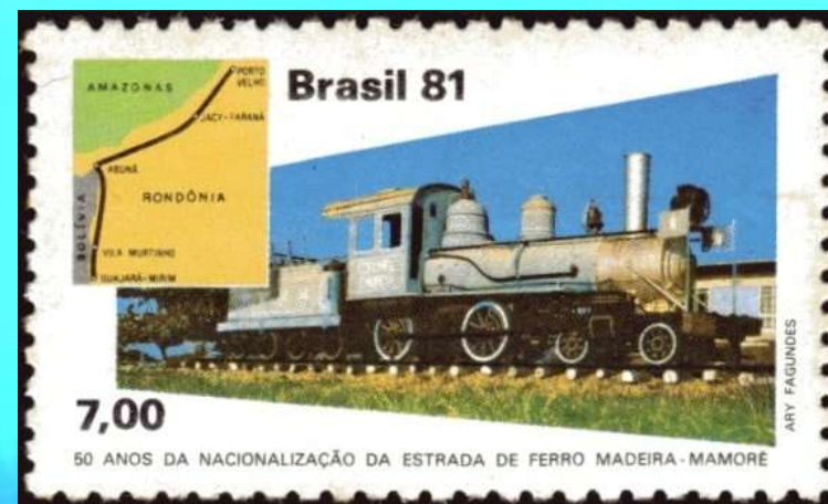
RHM C-1208 - Ferrovia Madeira-Mamoré

Manteve o programa de construção de ferrovias, incluindo a ferrovia Madeira-Mamoré e de escolas técnico-profissionais, iniciado no governo Afonso Pena. Instalou a Universidade do Paraná, concluiu as reformas e obras da Vila Militar de Deodoro e do Hospital Central do Exército além das vilas operárias no Rio de Janeiro.