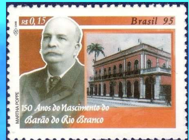
RHM C-1940 - 150 Anos do Nascimento do Barão do Rio Branco