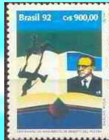
RHM C-1820 - Centenário de Nascimento de Menotti del Picchia

Tarsila do Amaral, considerada um dos grandes pilares do modernismo brasileiro se encontrava em Paris e por esse motivo não participou do evento.