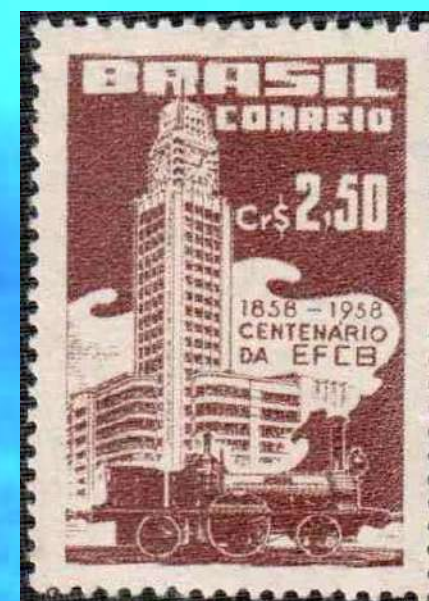
RHM C-403 - Centenário da Estrada de Ferro Central do Brasil