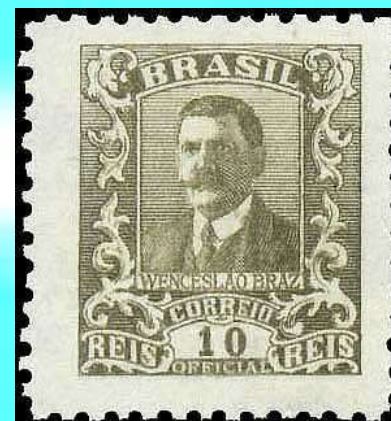
RHM O-30 - Wenceslau Braz

Promulgou o primeiro Código Civil brasileiro que entrou em vigor em 1 de janeiro de 1916, a primeira lei a grafar o nome Brasil com a letra S, elaborado por Clóvis Bevilacqua 15 anos antes!.