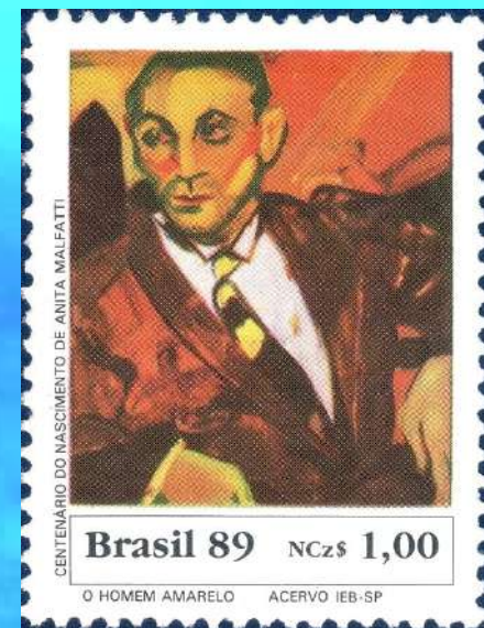
RHM C-1663 - Centenário de Nascimento de Anita Malfatti