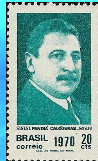
RHM C-683 - Pandiá Calógeras