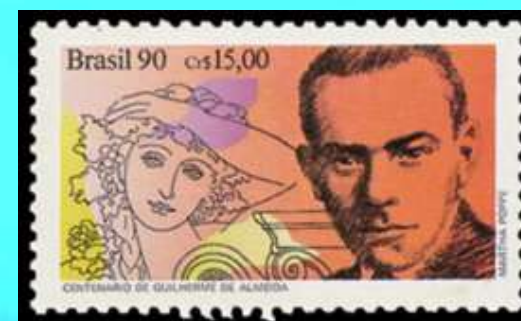
RHM C-1710 - Centenário de Nascimento de Guilherme de Almeida