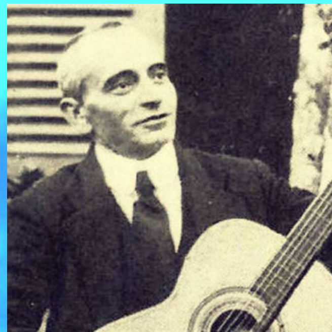
Catulo da Paixão Cearense