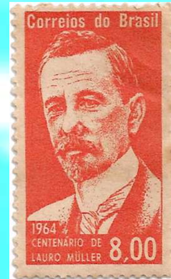
RHM C-508 - Centenário de Lauro Müller

O político João Pandiá Calógeras, especialista em política externa e assuntos militares faz um estudo sobre a entrada do Brasil na Primeira Guerra com financiamento norte americano, a pedido de Rodrigues Alves, que não foi utilizado. Impunha pesadas indenizações à Alemanha.