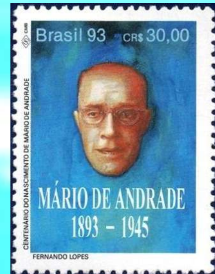
RHM C-1869 - Centenário de Nascimento de Mário de Andrade

Novas ideias e conceitos artísticos, como a declamação de poesias, concertos com música clássica contemporânea, artes plásticas, pinturas, esculturas e arquitetura com desenhos arrojados, rompendo com o passado conservador.