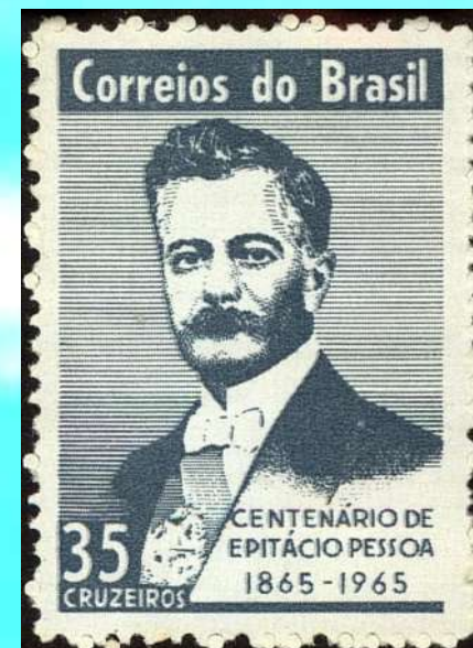
RHM C-529 - Centenário de Nascimento de Epitácio Pessoa

Governo foi politicamente conturbado, enfrentou a Revolta do Forte de Copacabana em 5 de julho de 1922, com a adesão do Forte do Vigia e dos alunos da Escola Militar, que visava a derrubada do Presidente e o impedimento da posse do novo presidente Artur Bernardes. A maior parte dos oficiais revoltosos desistiu, mas dezessete oficiais persistiram na rebelião, com o apoio de um civil. Os dezoito amotinados saíram pela praia de Copacabana em busca de seus objetivos enfrentando o restante do exército, sendo metralhados. Dezesseis morreram e dois, embora baleados, sobreviveram.