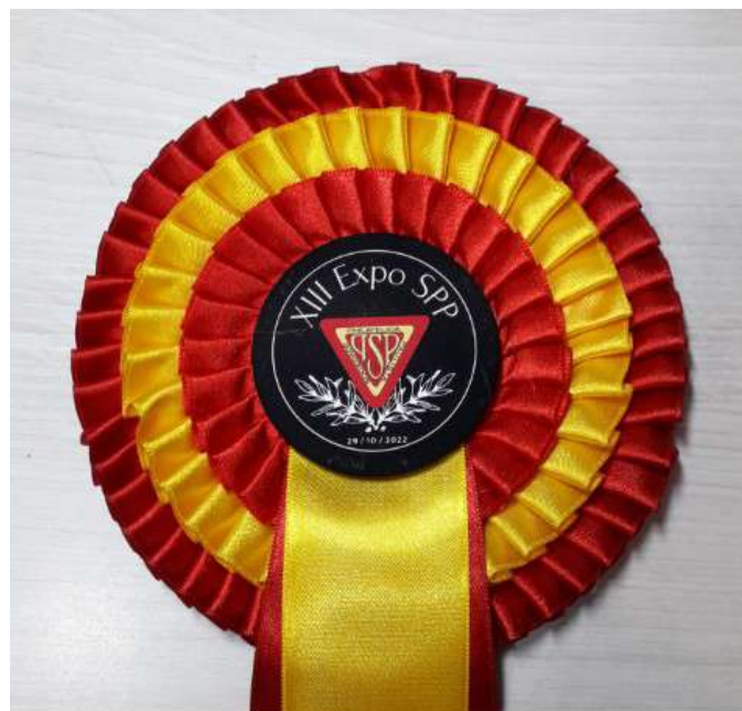
Medalha aos Expositores da XIII Expo-SPP