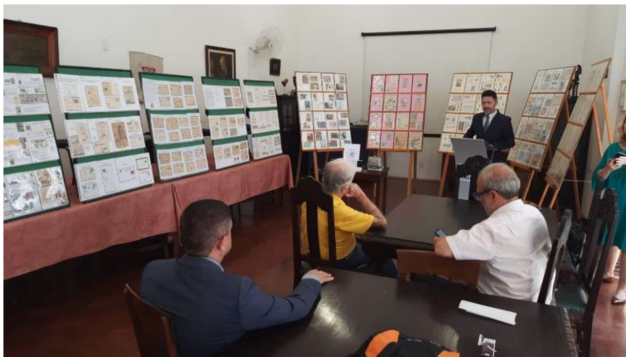
XIII Expo-SPP Visão panorâmica do salão da SPP