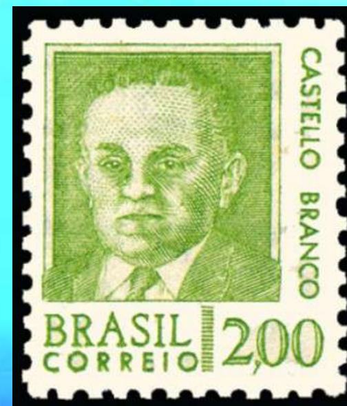
RHM 536 - Castello Branco

Depois do atentado iniciou-se uma intensa guerra interna contra as atividades de guerrilha e de terrorismo.