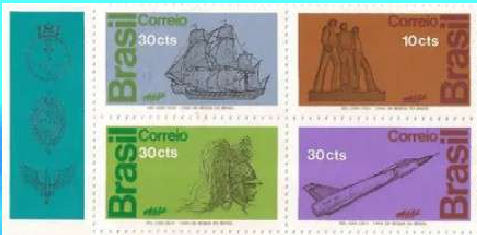
Homenagem às Forças Armadas RHM C-769 a C-772

Estava iniciado o período da ditadura militar no Brasil.