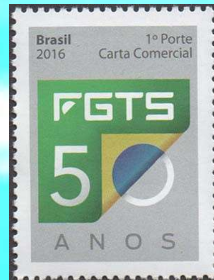
RHM C-3650 -50 Anos do FGTS

Foram unificados os institutos de previdência IAPI, IAPC, IAPTEC, entre outros, em um único, o INPS, atual, INSS; criou o Fundo de Garantia por Tempo de Serviço (FGTS).