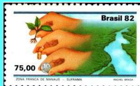
RHM C-1271 - Zona Franca de Manaus - Suframa