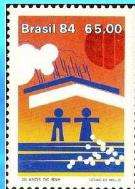
RHM C-1411 - 20 Anos do BNH Banco Nacional da Habitação