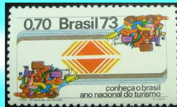
RHM C-784 - Ano Nacional do Turismo Promoção da Embratur

Castelo Branco morreu logo após deixar o poder, em um acidente aéreo ocorrido em 18 de julho de 1967.