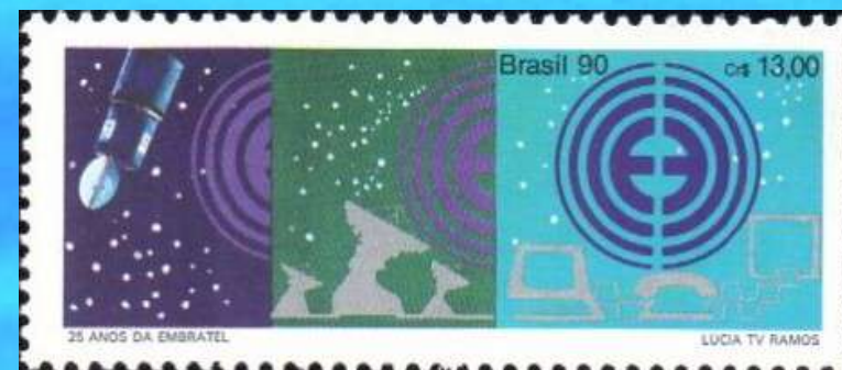
RHM C-1697 - 25 Anos da Embratel