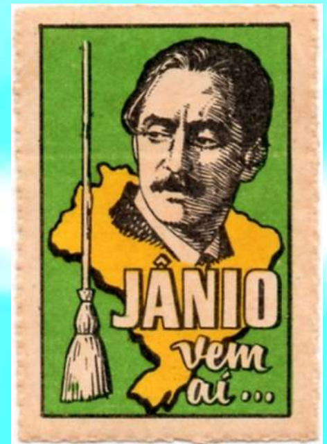
Propaganda eleitoral de Jânio Quadros

«Forças terríveis se levantaram contra mim...» , dizia o texto da renúncia.