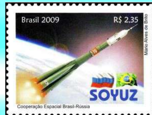
RHM C-2822 - Cooperação Espacial Brasil-Rússia

Criou as primeiras reservas indígenas e os primeiros parques ecológicos. Abriu centenas e centenas de inquéritos e sindicâncias em um combate aberto à corrupção e ao desregramento na administração pública.