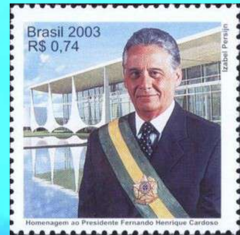
RHM C-2552 - Fernando Henrique Cardoso

Em janeiro de 1999, após a mudança do câmbio houve uma forte desvalorização do real. Para controlá-la, o governo aumentou os juros, diminuiu as reservas internacionais para tentar conter a disparada do dólar e recorreu ao Fundo Monetário Internacional (FMI) três vezes.