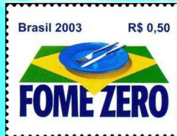
RHM C-2538 - Fome Zero

Durante o governo Lula houve uma crescente projeção da influência brasileira pelo mundo, tanto a nível econômico, como político e social.