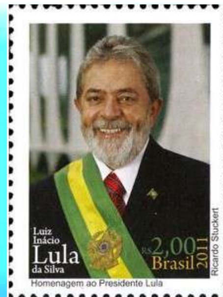
RHM C-3077 - Presidente Lula

Houve retomada da atividade em vários setores, pela recuperação da renda da população e expansão do crédito no País. A Agropecuária teve desempenho puxado pelo aumento do consumo de alimentos e da demanda internacional por commodities. O aumento da renda e crédito aumentou o desempenho da indústria do setor automotivo além do setor de Construção Civil.