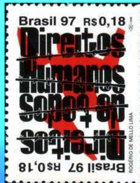
RHM C-2034 - Direitos Humanos

Criou mecanismos para impedir a aposentadoria precoce dos trabalhadores.