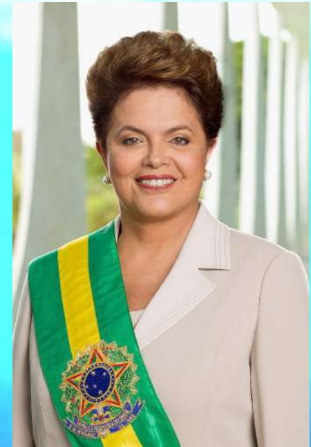
Presidente Dilma Rousseff

Em discurso na abertura da Assembleia da ONU defendeu o diálogo com o ISIS.