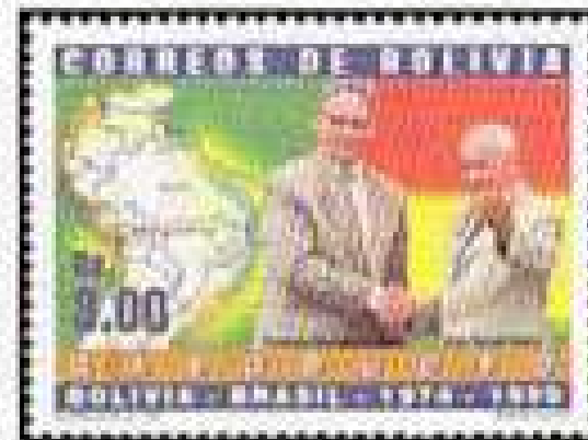
Completion of Bolivian-Brazilian Gas Pipeline — A432

Designs: 3b, Presidents of Bolivia and Brazil, map of pipeline. 6b, Presidents, gas flame.