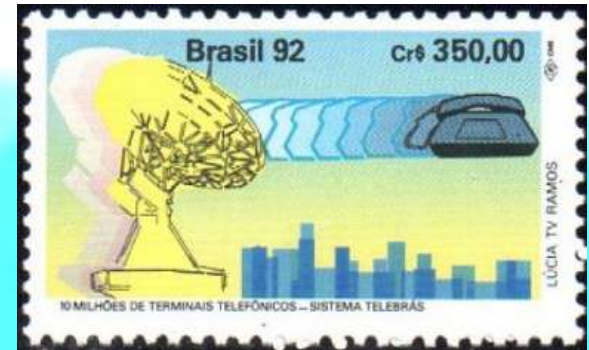
RHM C-1790 - Sistema Telebrás

O governo realizou as maiores privatizações da história: rodovias federais, bancos estaduais, empresas de telefonia e de energia, como a Vale do Rio Doce e a Telebras.