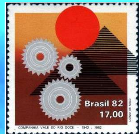
RHM C-1259 - 40 Anos da Companhia Vale do Rio Doce