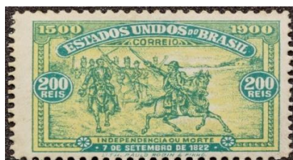
Imagem 10 - Independência do Brasil