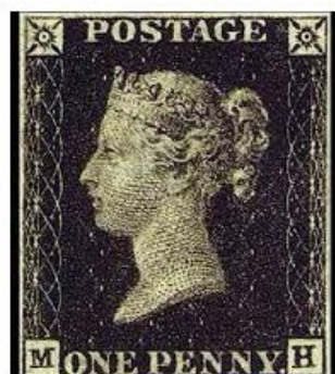
Imagem 1 – Selo postal Penny Black (efígie da Rainha Vitória) – Inglaterra

Disponível em: https://www.freeimages.com/pt/premium/queen-victoria-penny-black-stamp-1145005 . Acesso: 04 de julho de 2022.