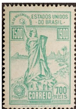
Imagem 11 - Proclamação da República