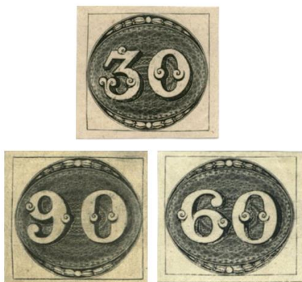
Imagem 7 - Série Olhos de Boi

Disponível em: https://www.philatelialel.br/peca.asp?ID=6837444 . Acesso: 04 de julho de 2022.