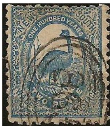
Imagem 4 - Selo postal comemorativo da Colônia de Nova Gales do Sul – Austrália