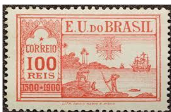
Imagem 9 - Chegada de Cabral ao Brasil

Disponível em: https://repositorio.ufpe.br/bitstream/123456789/3624/1/arquivo94_1.pdf . Acesso: 24 de junho de 2022.