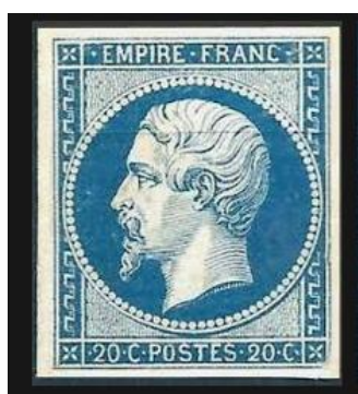
Imagem 2 – Selo postal comemorativo Efígie Coroada de Louros de Napoleão III – França

Disponível em: http://www.brasilcult.pro.br/filatelica/classicos/classicos01.htm . Acesso: 04 de julho de 2022.