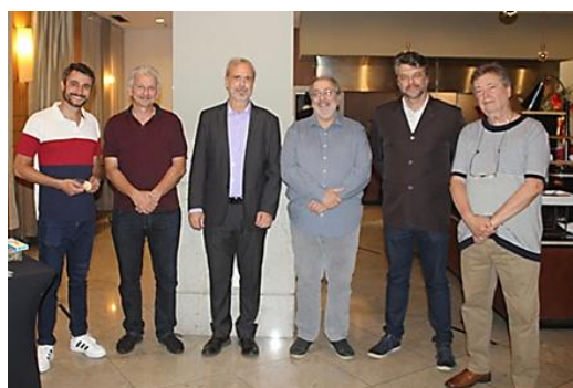
Júri da BRAPEX 25.

Na tarde de 12 e manhã do 13 de dezembro de 2025 ocorreu a tradicional e importante sessão de “Feedback”, momento no qual os jurados se encontram com os expositores e apresentam a pontuação e comentários para o expositor aprimorar seu trabalho.