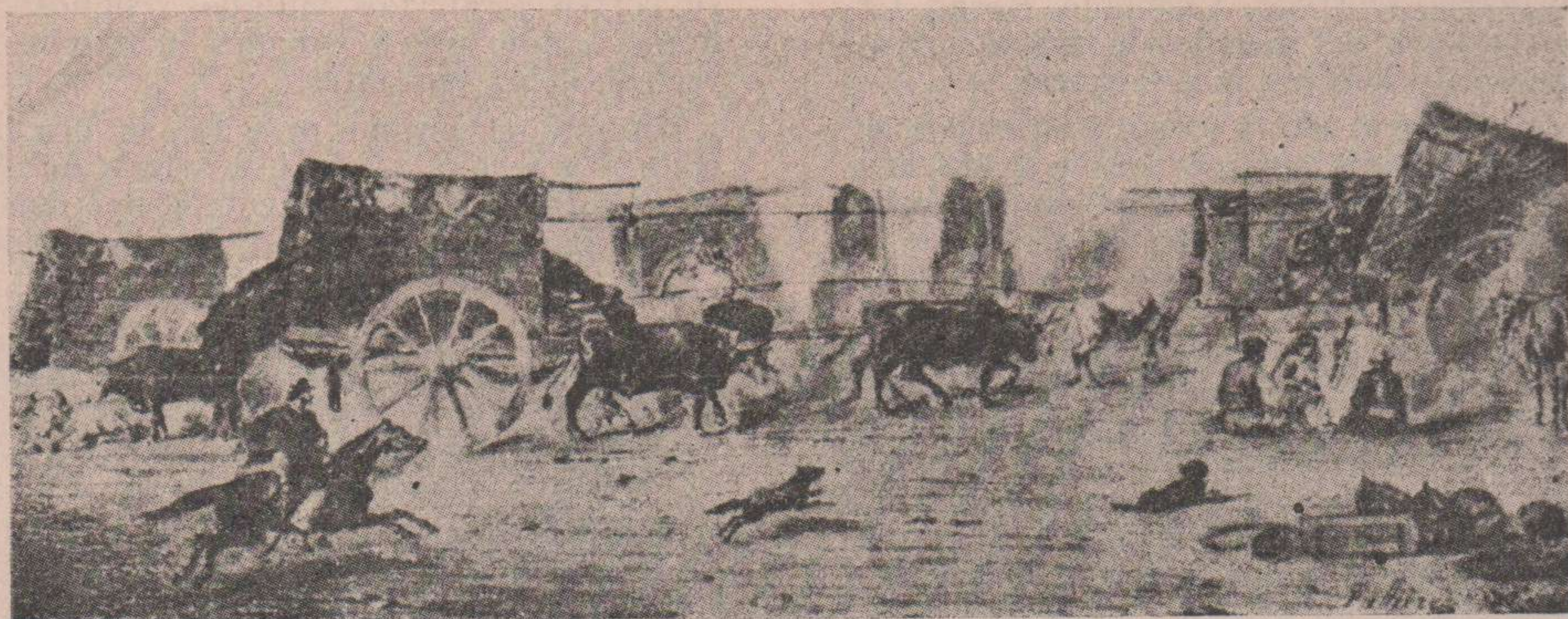
Tropa de Carretas (Oleo de Pallière)

El 18 de Junio fué nombrado en su reemplazo el Dr. Miguel Cané . Durante su corta estada de cuatro