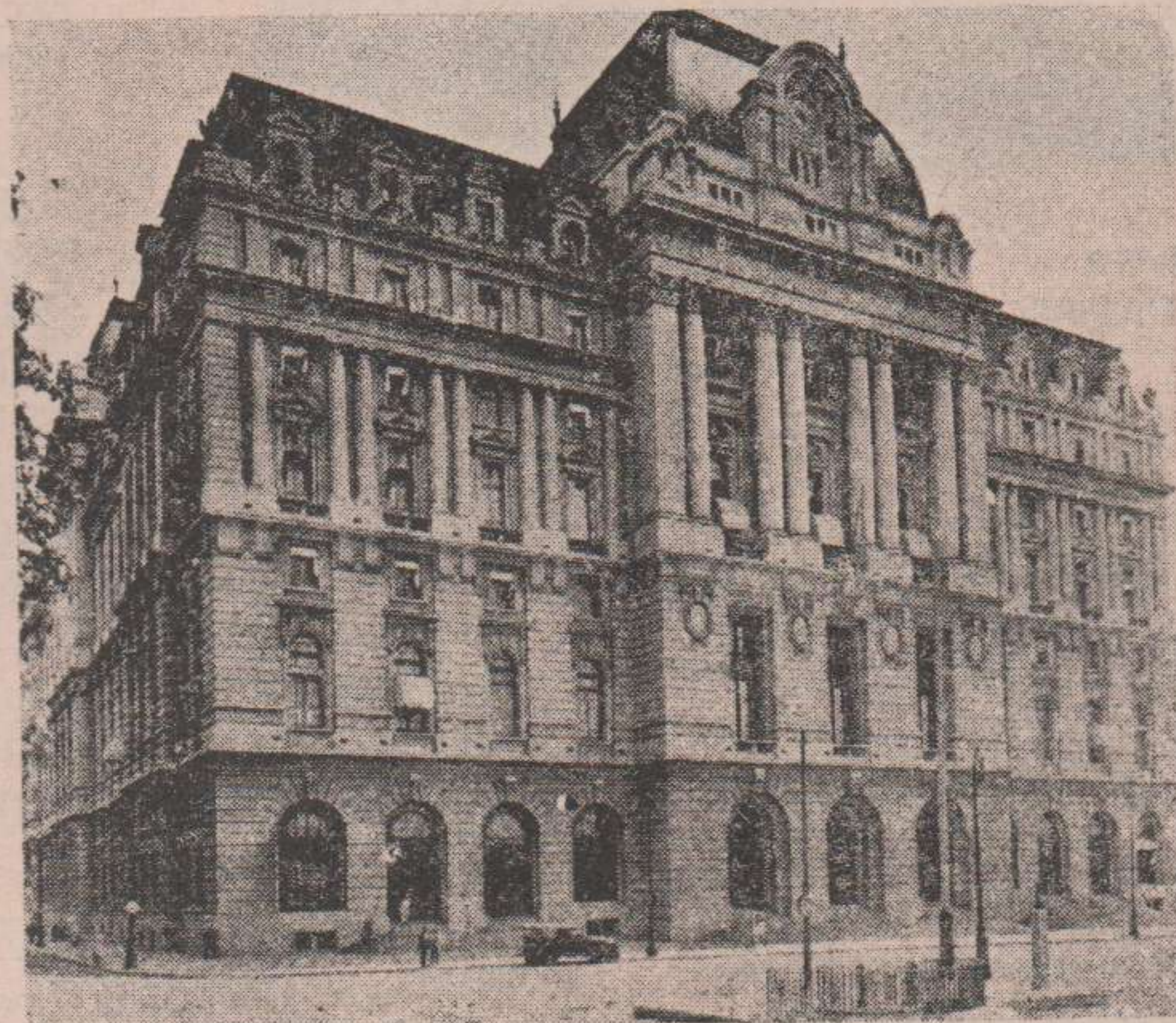
Palacio Central de Correos y Telecomunicaciones (Buenos Aires)