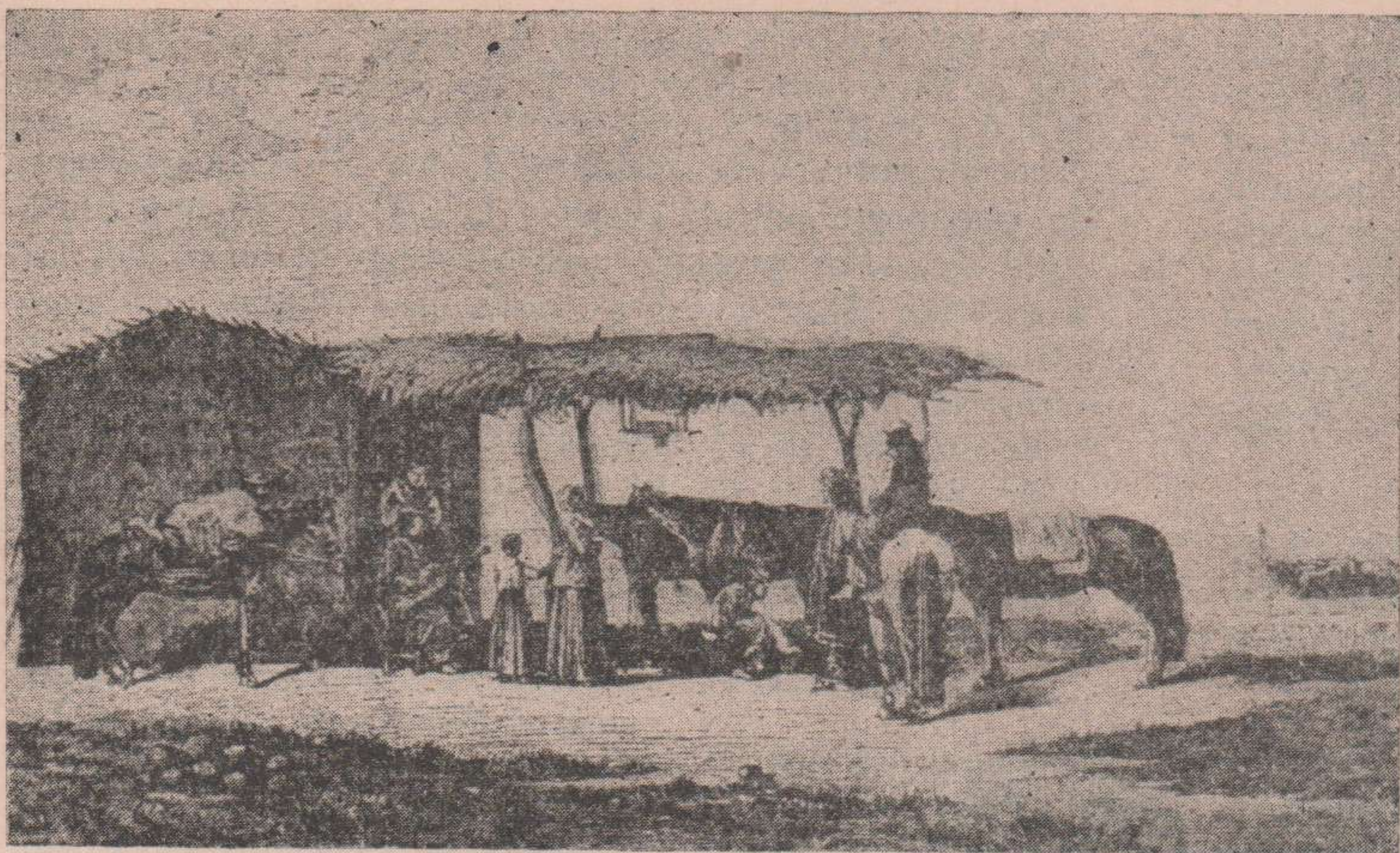
La Posta (Oleo de Pallière)

so Postal de Lisboa, regresando después de haber firmado el convenio sobre giros y encomiendas postales internacionales. Ambos servicios fueron incorporados a la Repartición, con lo cual se le dió un gran impulso. En 1880-81 establecieron en el país las primeras líneas de Teléfonos, que quedaron sujetos a la Ley de Telégrafos desde el año 1883.