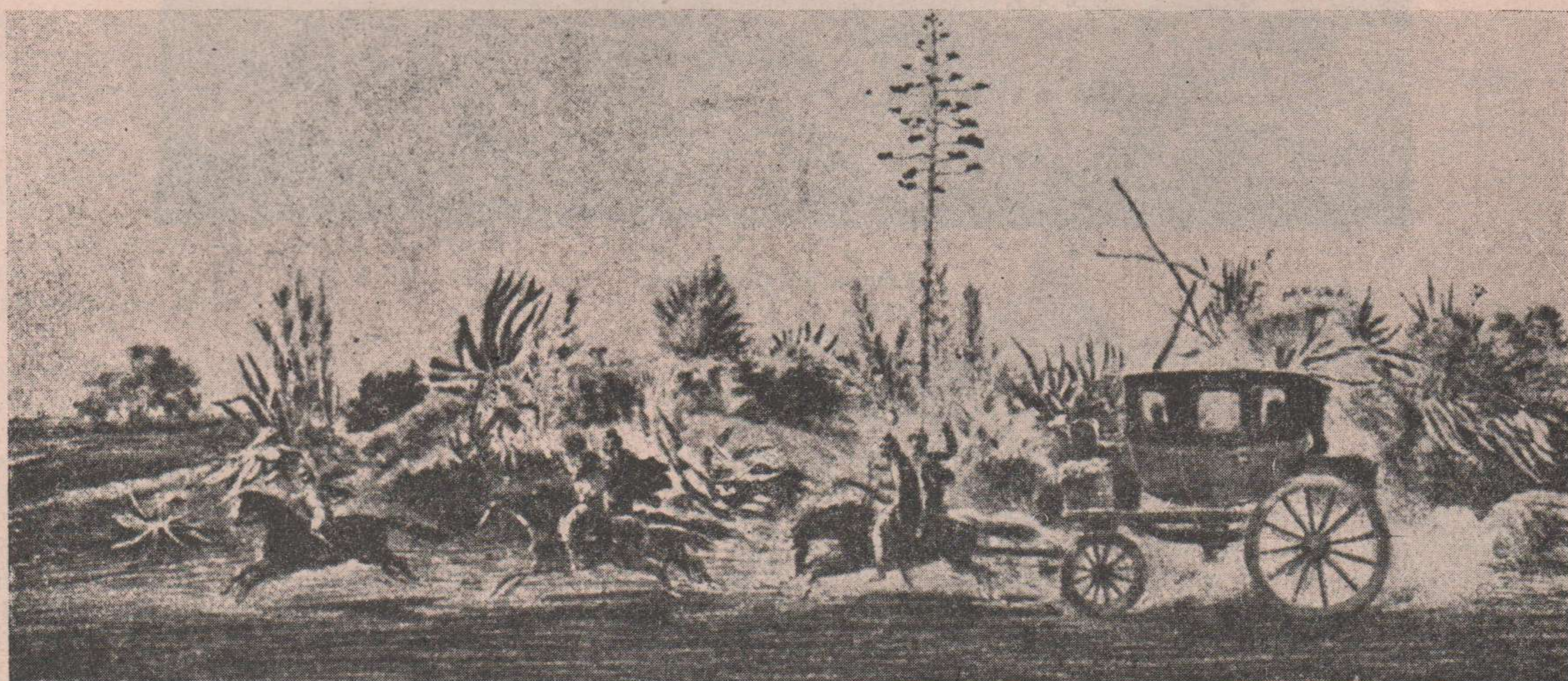
Viajando por las postas (Oleo de Pallière)