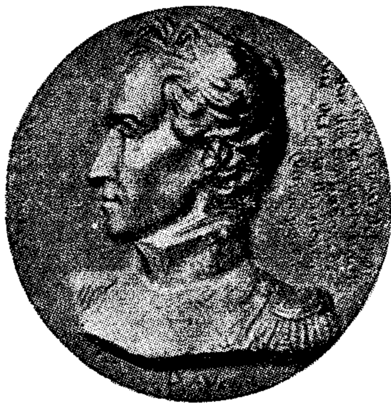
Bolívar por Pierre J. David d'Angers.

La parte norte de la América del Sud, que comprende los territorios que actualmente ocupan Venezuela, Colombia, Panamá y Ecuador, formaban antiguamente una unidad, que dependía del Virreinato del Perú hasta 1739, en que pasó a depender del Virreinato de Nueva Granada, cuya capital fué Santa Fe de Bogotá.