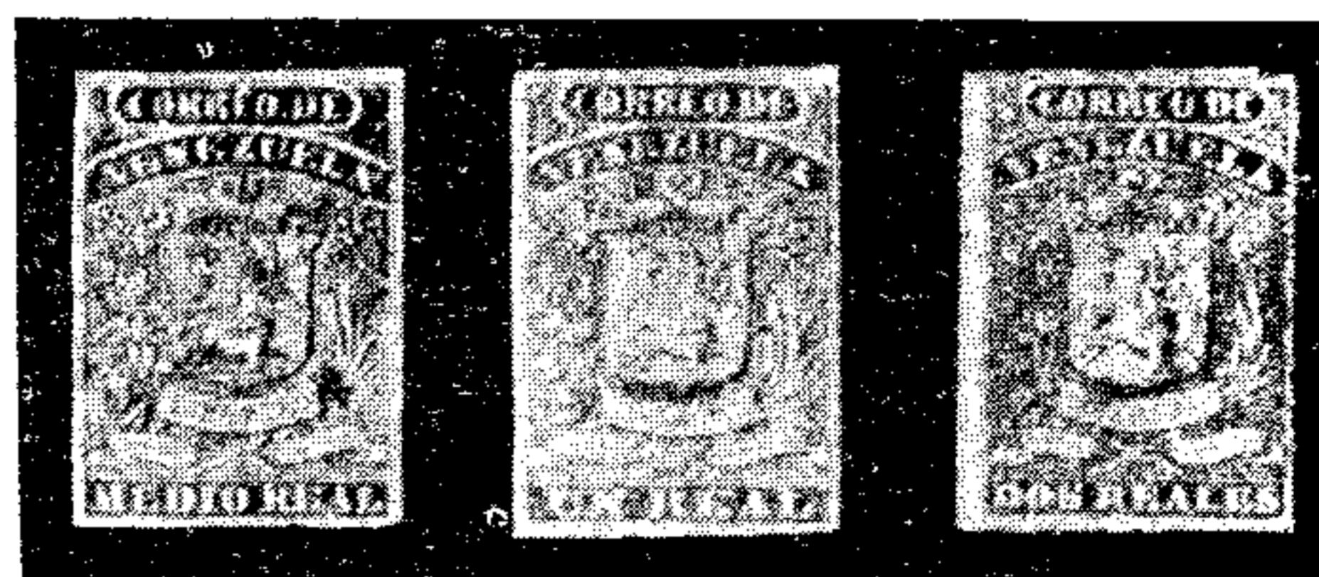
Primera serie de valores postales emitida en 1858.

El 27 de agosto de 1860 se firmó un convenio postal con EE.UU. de Norte América y en junio de 1861 otro con Gran Bretaña, a consecuencia de la cual se ajustaron los contratos sobre navegación marítima. En 1863 nombróse Director General de Correos al general D. Federico Uslar . En 1867 se celebró otro convenio postal con Inglaterra y en 1869 se reformó la Ley de Correos.