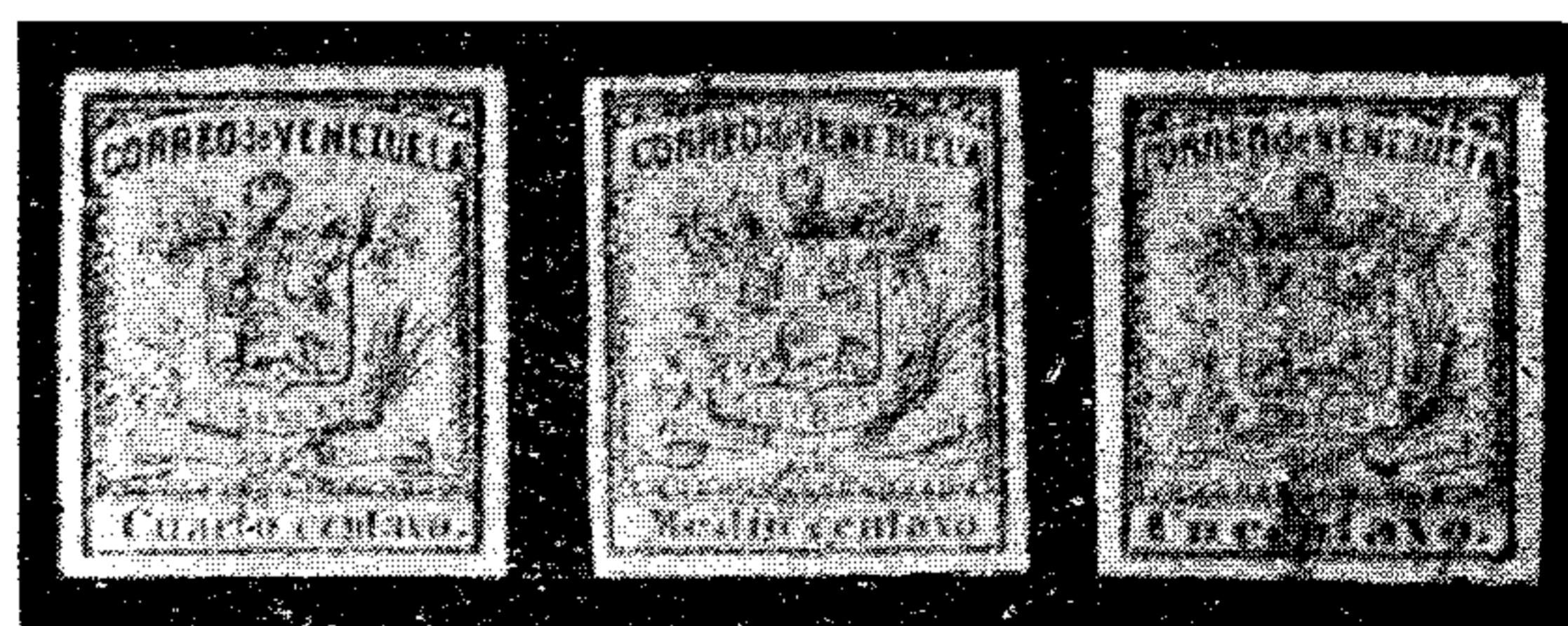
Emisión de sellos de 1852.

Durante el gobierno del General Antonio Guzmán Blanco se introdujeron muchos adelantos en el país: se establecieron las primeras líneas de ferrocarriles (1873) y se construyeron numerosos caminos. En materia postal dispuso la reforma de muchos servicios, ajustándolos a los adelantos de la época. Con posterioridad y hasta comienzos de este siglo, el Correo venezolano ha seguido todos los progresos en materia de comunicaciones terrestres, marítimas, aéreas y eléctricas.