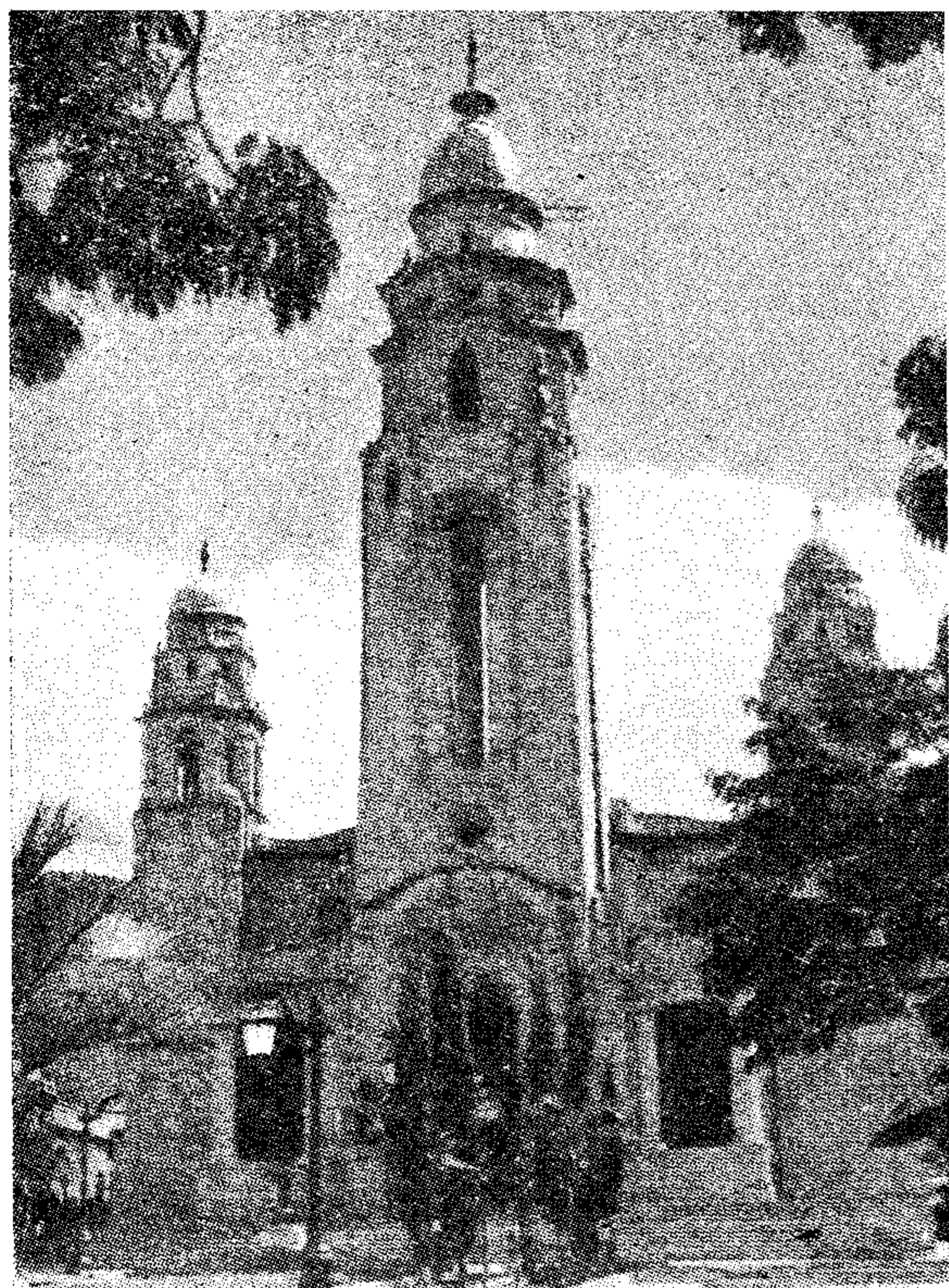
Panteón Nacional donde descansan los restos del Libertador, Simón Bolívar.

Reunida en Valencia la Asamblea Constituyente, decide crear el nuevo "Estado de Venezuela", el 6 de mayo de 1831, designándose primer Presidente de la República al General D. José Antonio Páez. A su iniciativa se debe la reorganización de los servicios postales, fijándose nuevas tarifas en 1832 y 1834,