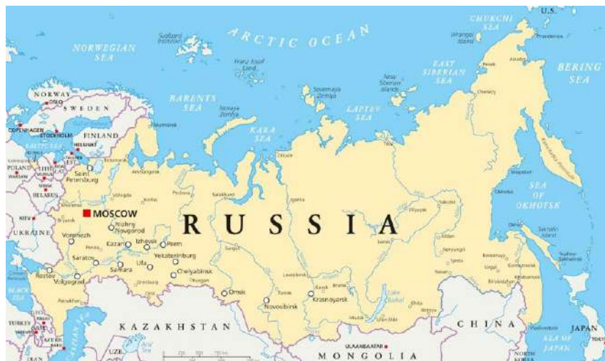
Mapa Federação Russa.

A coleção a ser exposta consiste em selos do período de 1930 a 2014.